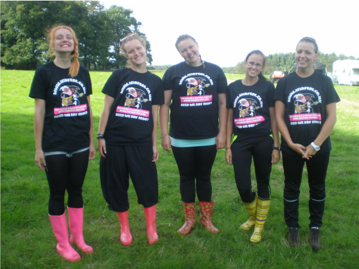
2. pilt – Eesti grupi pilt UK EVSIl