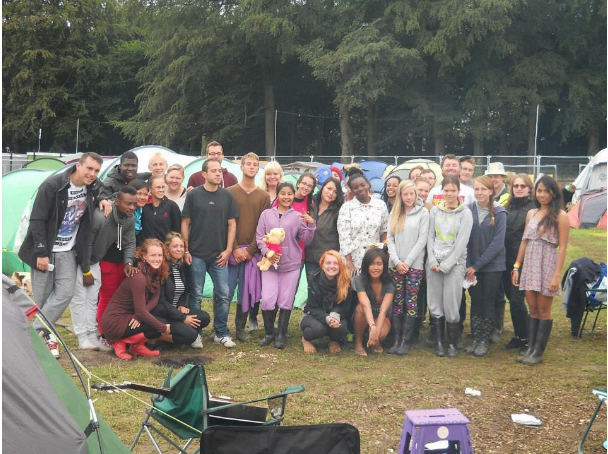
1. pilt – Grupipilt UK grupi EVSist